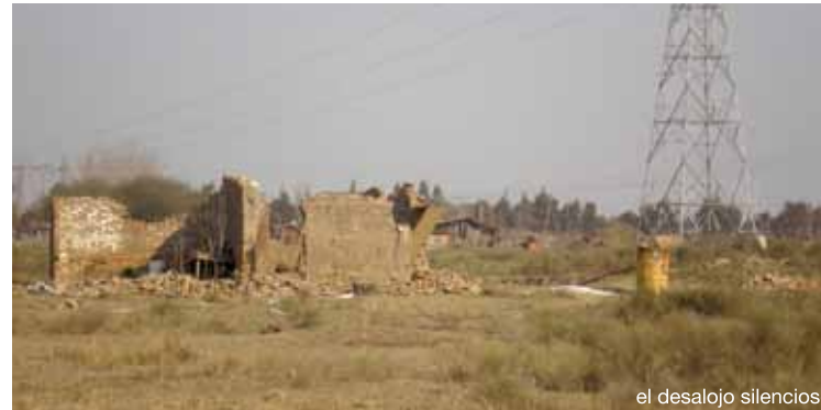
el desalojo silencioso