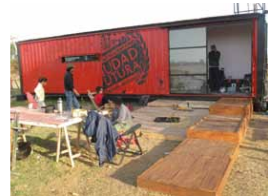
prototipo de vivienda para la ciudad futura

El primer prototipo de vivienda de la Ciudad Futura está prácticamente terminado y fue construido con un innovador método constructivo basado en containers marítimos que, a través de la autoconstrucción, se convierten en dignas y bellas viviendas.