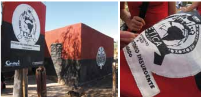
ETICA (Escuela del Territorio Insurgente Camino Andado)