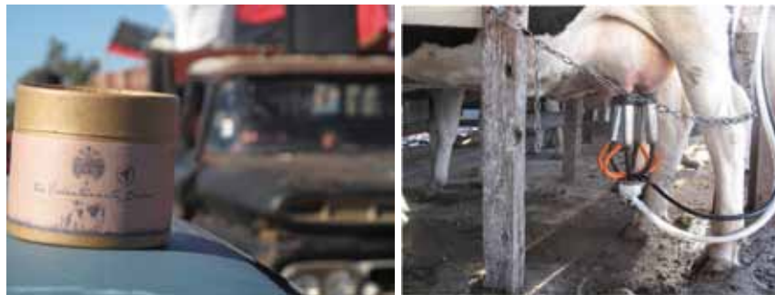
Tambo "La Resistencia"

La Escuela Territorial Insurgente Camino Andado (ETICA) es parte del Plan de Seguridad Territorial que Giros presentó al Municipio. Es parte de la propuesta que se hizo en el marco del acampe, y que se comunicó a los funcionarios como parte fundamental del trabajo que se hace en un territorio amenazado por el accionar de los monopolios inmobiliarios. Es apostar al arraigo de las comunidades que habitan la periferia rosarina y, fundamentalmente, es una respuesta NO violenta a los desalojos.